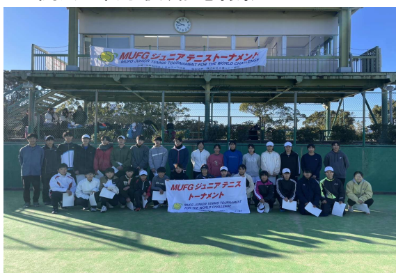
開会式終了後、記念撮影